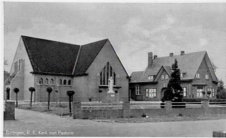
Ansichtkaart herstellde kerk Beringe

Nog altijd staan de kerk en pastorie er, zoals tijdens de herstelwerkzaamheden van de verwoestingen, die tegen het einde van de oorlog aan het gebouw waren toegebracht, zijn gedaan. Wat zal het een werk zijn geweest en zoals in de verslagen te lezen staat, kon men het niet in één keer doen. De bouw van de nieuwe toren zou nog enkele jaren moeten wachten. Blij was men in de parochie, dat men de missen weer op de oude plek kon gaan volgen.